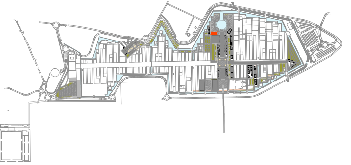
Keymap - AREA DI INTERVENTO