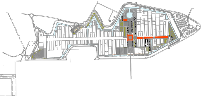
Keymap - AREA DI INTERVENTO