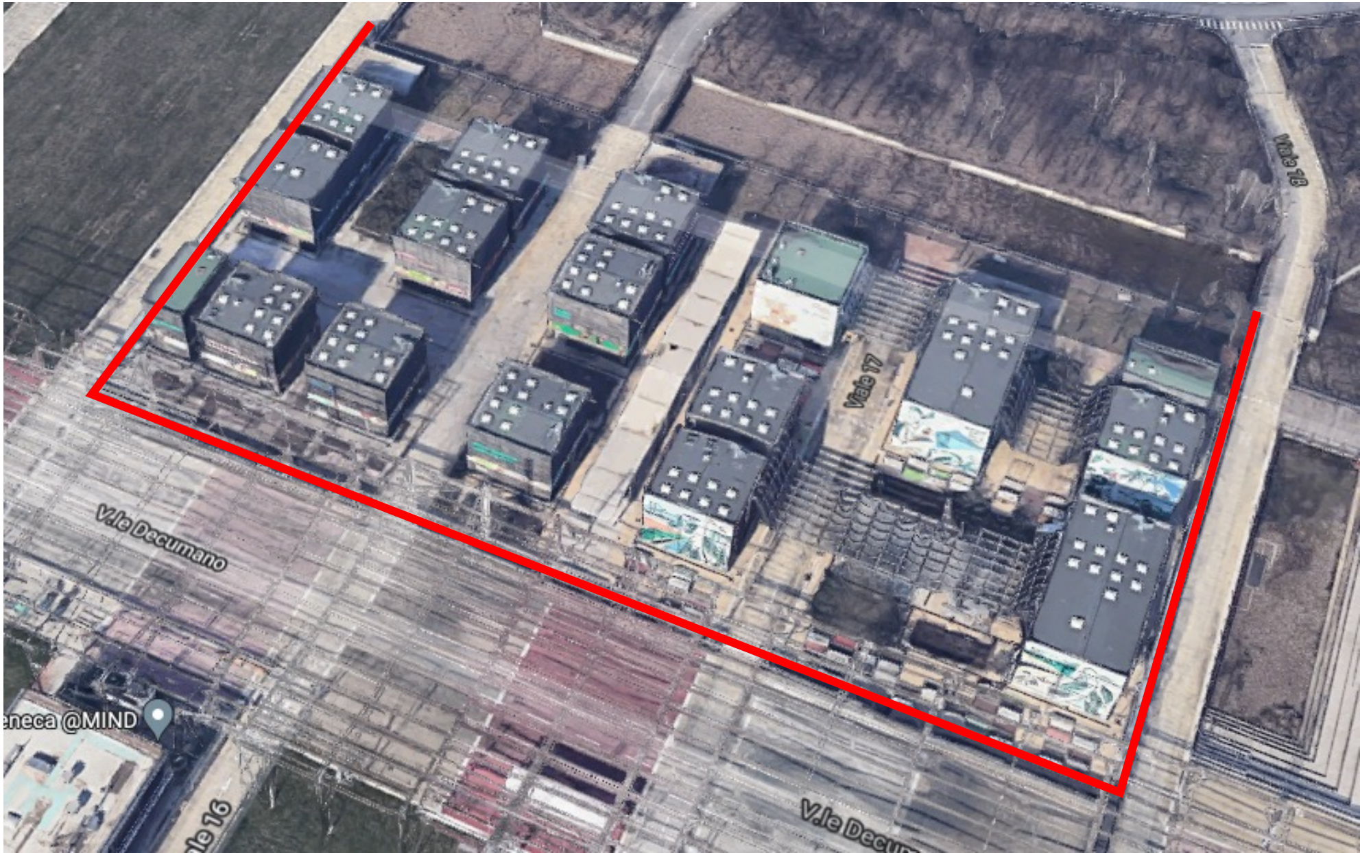
Lotto 1 Cluster FL 300 ml